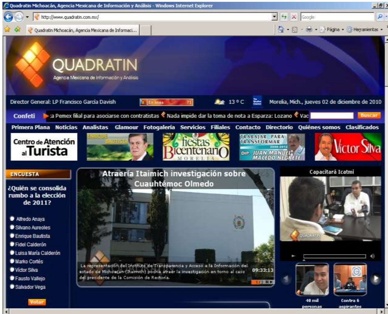
Página de Internet de Víctor Silva Tejeda. http://www.victorsilvatejeda.com/