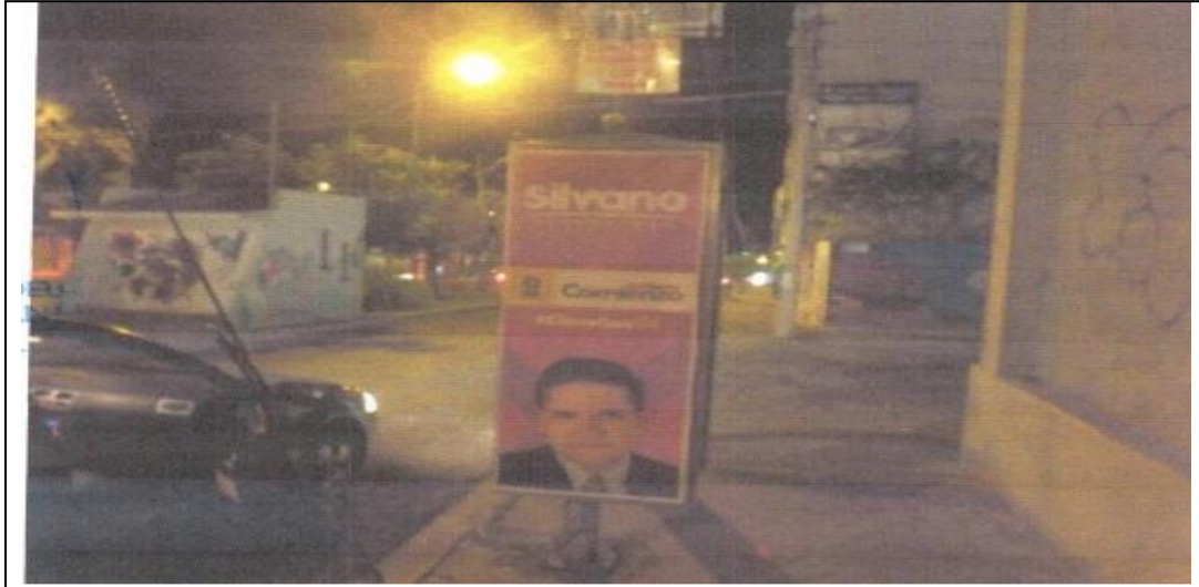
Periférico Paseo de la República, esquina con calle Ocolusen, colonia Nueva Ocolusen, de esta ciudad (frente al oxxo al lado del Periódico Provincia).

Como se aprecia de las imágenes, la colocación de la propaganda está adherida a casetas telefónicas, las cuales son parte del equipamiento urbano, del cual la normativa prohíbe colocar propaganda electoral durante las precampañas y las campañas, como acontece en la especie.