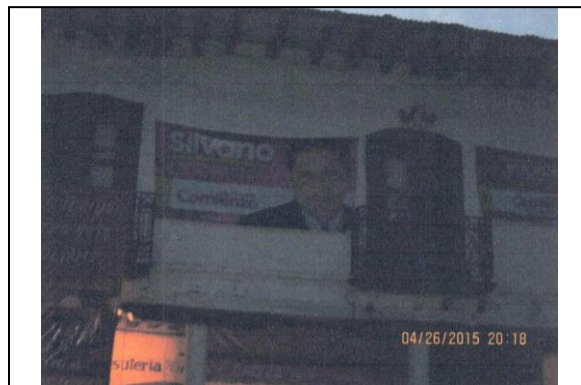
Imagen 5 Silvano Aureoles Conejo y Partido de la Revolución Democrática

Como se advierte de las imágenes insertas, se trata de propaganda de naturaleza electoral, toda vez que contiene los elementos siguientes: