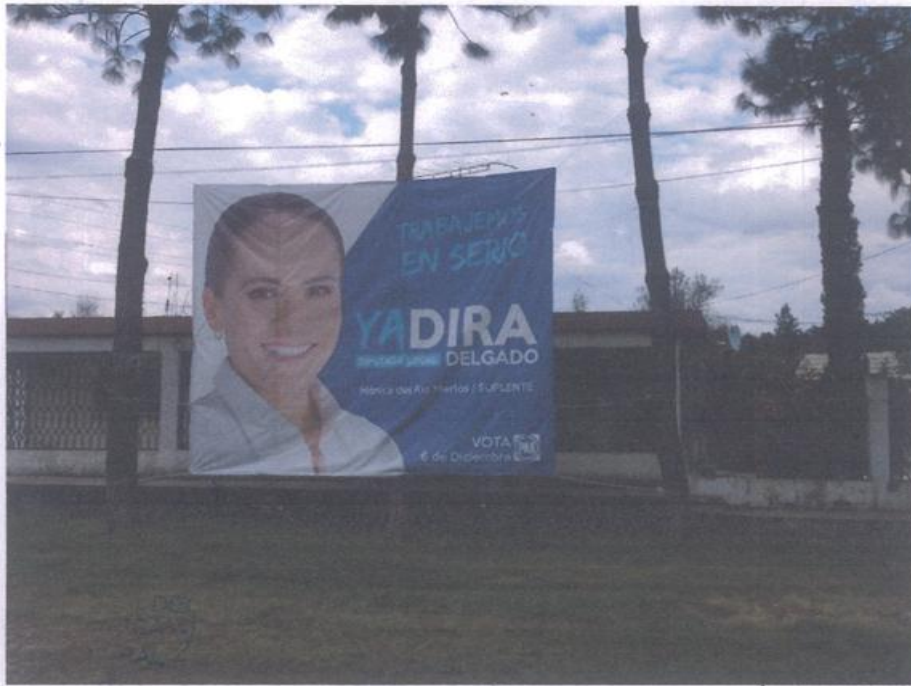
EN OTRA TOMA FOTOGRAFICA MISMA LONA DEL PARTIDO ACCION NACIONAL, DE LA ELECCION DE DIPUTADO LOCAL DISTRITO 12 DE HIDALGO, SE ENCUENTRA SUJETADA EN ARBOLES, SU UBICACIÓN SE ENCUENTRA EN EL DOMICILIO ENTRADA DE LA LOCALIDAD CRUZ DE CAMINOS, A LADO DE LA CARRETERA MEXICO-MORELIA. -----