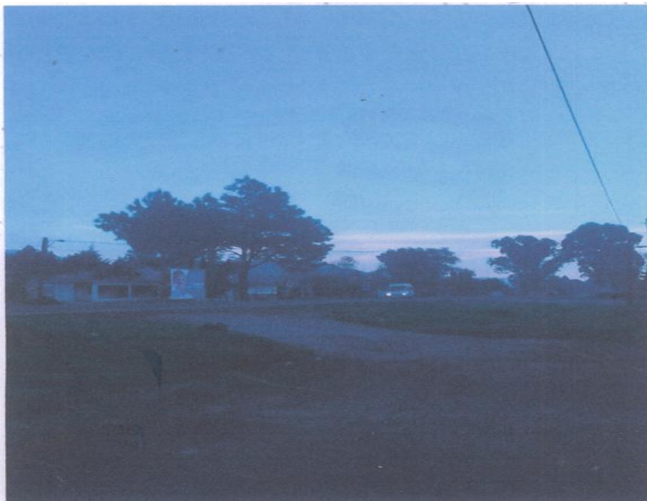
EN OTRA TOMA FOTOGRAFICA SE MUESTRA IMAGEN DE LA LOCALIDAD DONDE SE ENCUENTRA LA MISMA LONA MENSIONADA DEL PARTIDO ACCION NACIONAL, DE LA ELECCION DE DIPUTADO LOCAL DISTRITO 12 DE HIDALGO, SE ENCUENTRA SUJETADA EN ARBOLES, SU UBICACIÓN SE ENCUENTRA EN EL DOMICILIO DE LA ENTRADA A LA LOCALIDAD CRUZ DE CAMINOS, A LADO DE LA CARRETERA MEXICO-MORELIA. -----

Del contenido de las imágenes plasmadas anteriormente, es dable afirmar que la conducta denunciada se ubica en la hipótesis prevista tanto en la fracción III, del citado numeral 171, del Código Electoral del Estado de Michoacán, como en el considerando quinto del acuerdo emitido por el Consejo General del Instituto Electoral de Michoacán identificado con clave CG-361/2015, referentes a la prohibición de los partidos políticos y candidatos de colocar propaganda electoral en árboles, cualquiera que sea su régimen jurídico.