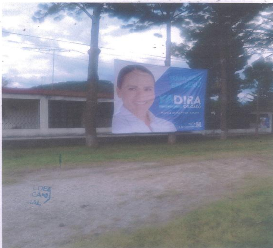
LONA DEL PARTIDO ACCION NACIONAL, DE LA ELECCION DE DIPUTADO LOCAL DISTRITO 12 DE HIDALGO, SE ENCUENTRA SUJETADA EN ARBOLES, SU UBICACION SE ENCUENTRA EN EL DOMICILIO ENTRADA DE LA LOCALIDAD CRUZ DE CAMINOS, A LADO DE LA CARRETERA MEXICO-MORELIA. -----

Para corroborar la anterior afirmación, es necesario traer a contexto, la parte conducente de las actas referidas.