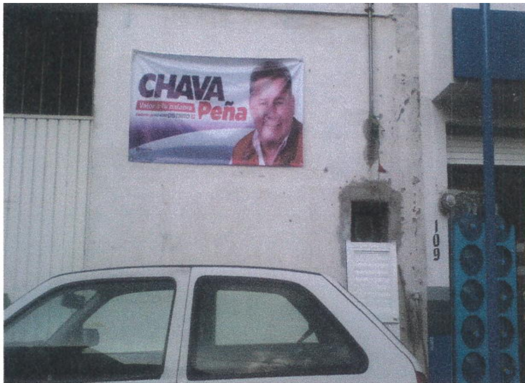
Ubicación: Lona en calle Francisco González Bocanegra, entre calle 5 de Febrero y calle 16 de Septiembre, a lado del negocio de abarrotes, Hidalgo, Michoacán.