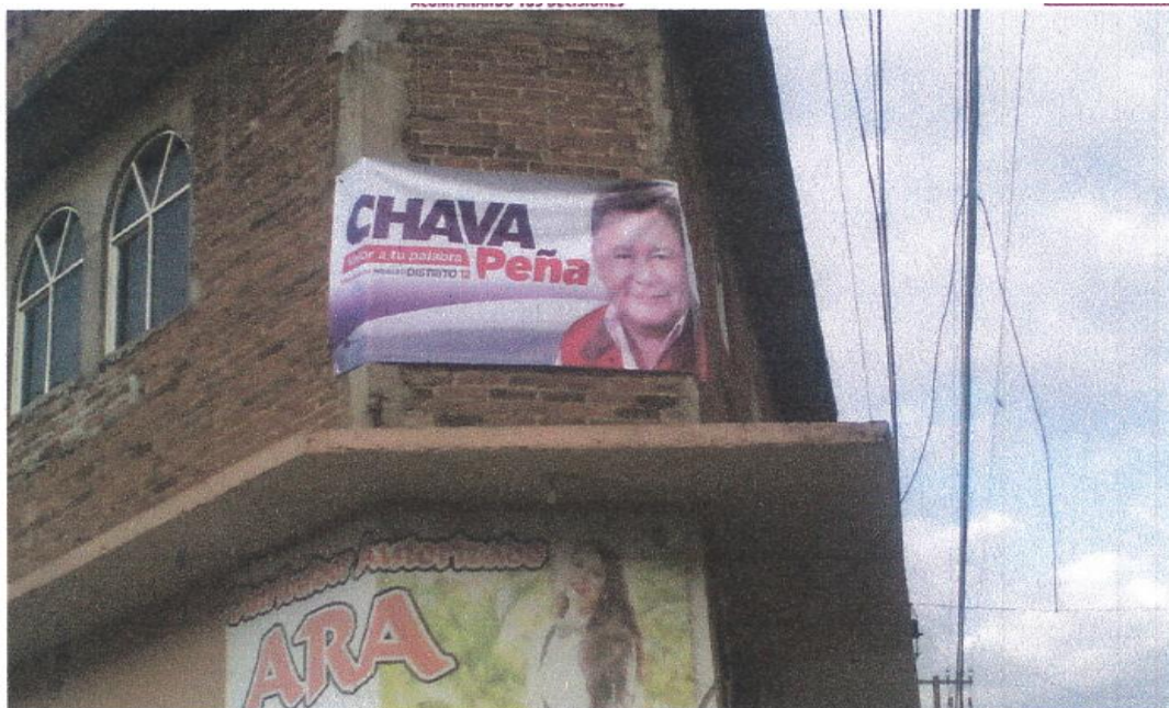
Ubicación: Lona en calle Vicente Guerrero sin número y calle 20 de Noviembre, Colonia La Mangana, Hidalgo, Michoacán.