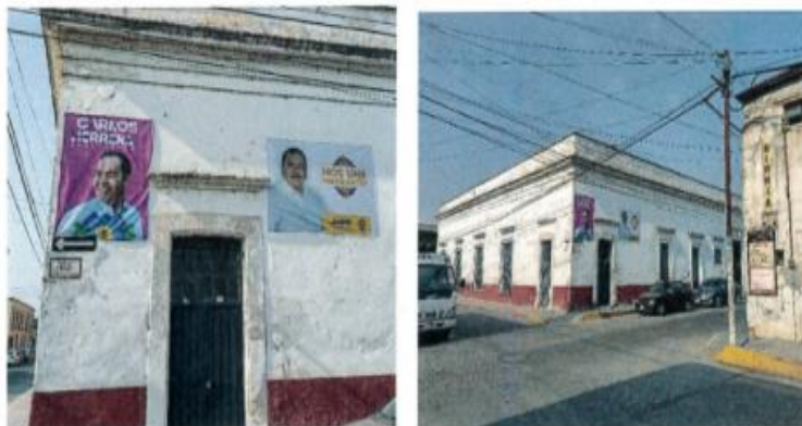
IMAGEN 1 y 2

Instituto Electoral de Michoacán Comité Distrital Maravatío