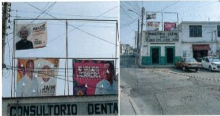
IMAGEN 5 y 6