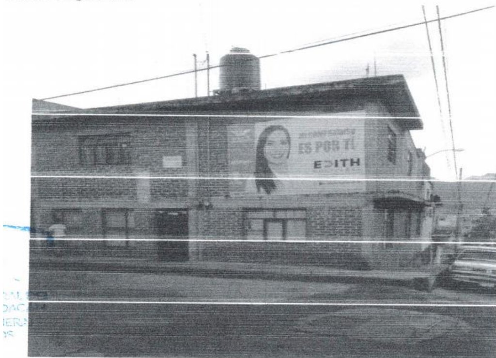
Placa Fotográfica 2.

Contenido: "MI COMPROMISO ES POR TI, EDITH CONTRERAS". y el logo del Partido Movimiento Ciudadano