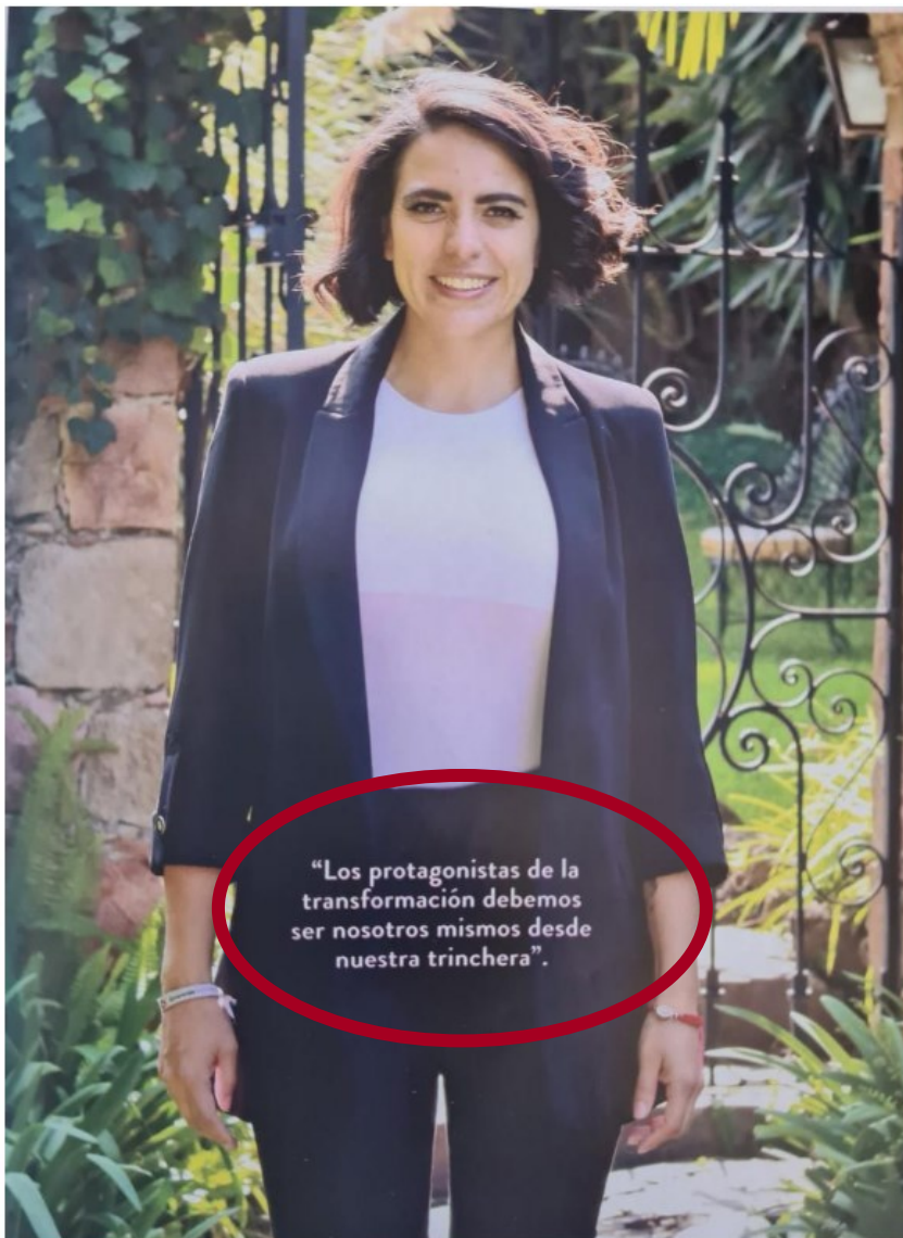
IMAGEN DE LA REVISTA

Así pues, del examen minucioso y exhaustivo de las publicaciones realizadas, atendiendo a los criterios señalados, tanto por la Sala Superior, así como la Sala Regional Toluca, en los que han señalado que el análisis de los elementos