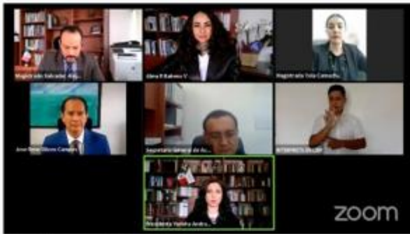
25 de Agosto 2021, Transmisión en vivo TEEMICH- SESIÓN PÚBLICA, Morelia