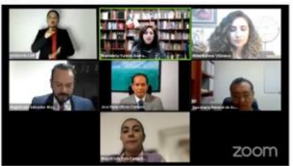
29 de Agosto 2021, Transmisión en vivo TEEMICH- SESIÓN PÚBLICA, Morelia