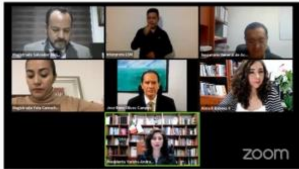
26 de Agosto 2021, Transmisión en vivo TEEMICH- SESIÓN PÚBLICA, Morelia