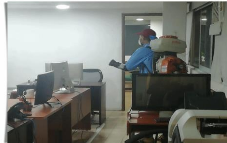
*Este lunes se realizó una vez más, una jornada de sanitización de espacios y oficinas. Morelia, Michoacán, a 30 de agosto de 2021.- En medio de la pandemia por COVID-19, el Tribunal Electoral del Estado de Michoacán (TEEM) se ha