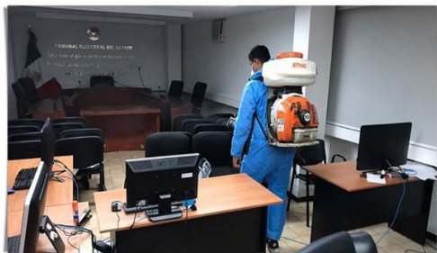
Morelia, Michoacán, a 20 de agosto de 2021.- En aras de salvaguardar la salud y la vida de las y los trabajadores así como de las y los ciudadanos que visitan el Tribunal Electoral del Estado de Michoacán, este viernes se llevó a cabo una vez más la tarea de sanitización de las oficinas que albergan a la institución.