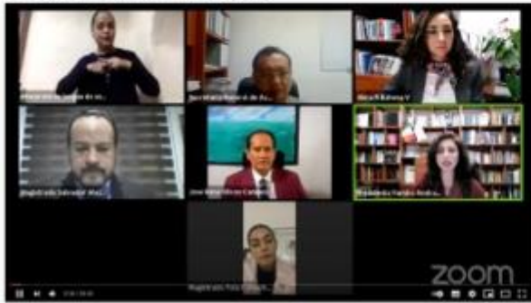
27 de Agosto 2021, Transmisión en vivo TEEMICH- SESIÓN PÚBLICA, Morelia