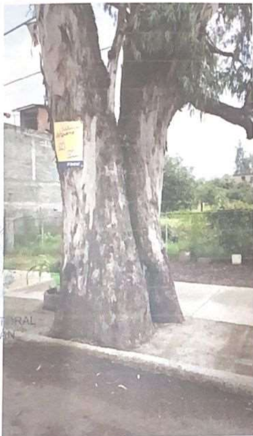
IMAGEN 3 y 4