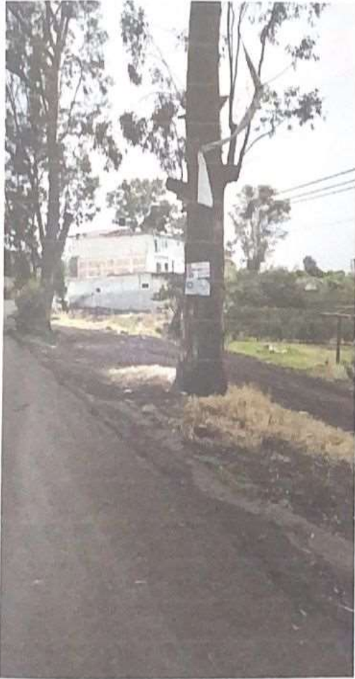
IMAGEN 1 y 2