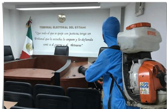
Morelia, Michoacán, a 9 de septiembre de 2021.- Con la finalidad de seguir priorizando la salud y vida de las y los trabajadores, así como de los