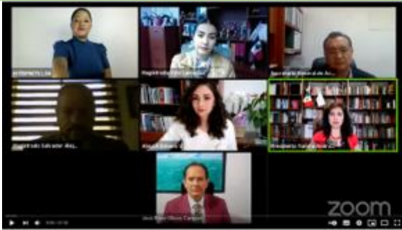
1 de septiembre 2021, Transmisión en vivo TEEMICH - SESIÓN PÚBLICA, Morelia