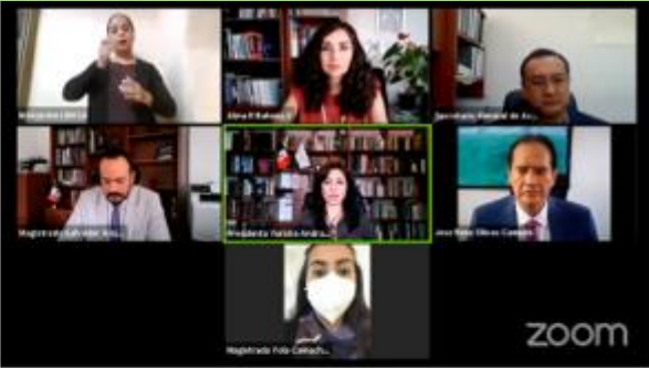
8 de septiembre 2021, Transmisión en vivo TEEMICH - SESIÓN PÚBLICA, Morelia