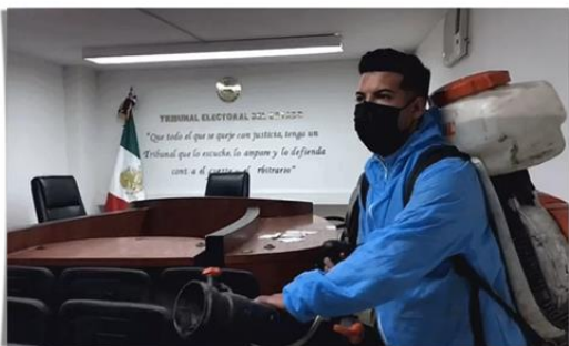
Morelia, Michoacán, a 23 de septiembre de 2021.- Este jueves se realizó una jornada más de sanitización de las oficinas que albergan el Tribunal Electoral del Estado de Michoacán (TEEM).